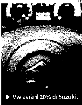
► Vw avrà il 20% di Suzuki.

Con questi due colpi, Volkswagen si propone come il principale candidato a togliere a Toyota lo scettro di gruppo n° 1 al mondo. «Ma non prima del 2018» ha detto il presidente di Vw Ferdinand Piech. Siamo nell'era delle partnership: solo pochi giorni fa il gruppo Psa Peugeot-Citroen ha annunciato l'alleanza con Mitsubishi. Un'epopea aperta da Fiat con l'intesa con Chrysler. «Fra 10 anni ci saranno solo 5-6 maxi-gruppi» è l'opinione espressa più volte da